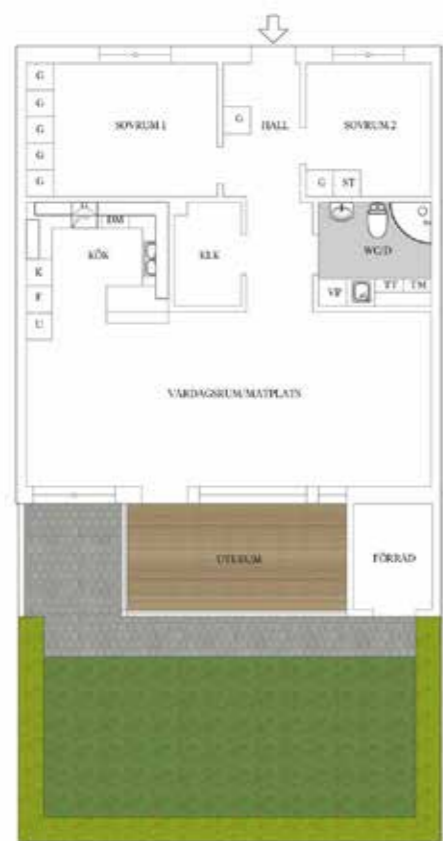
LGH 3, 5