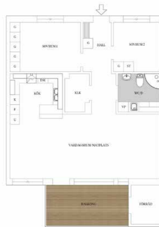
LGH 10, 12