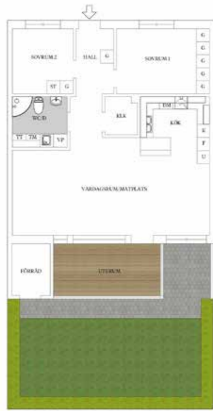
LGH 2, 4, 6