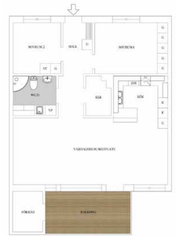
LGH 9, 11, 13