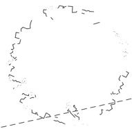
PLAN 2 SKALA 1:100